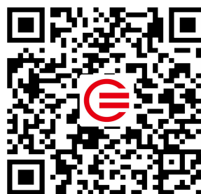
教育装备网公众号