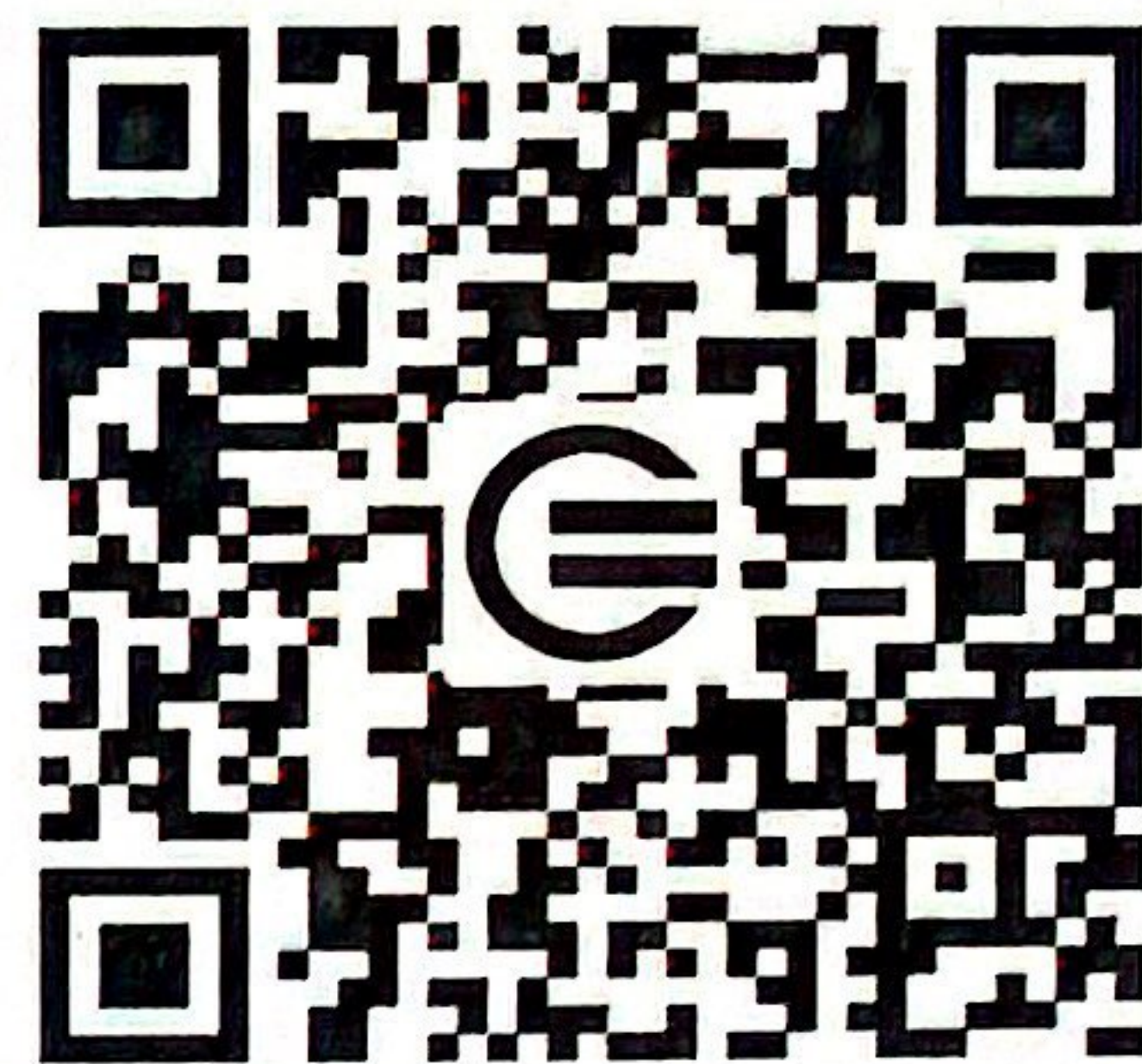
教育装备网公众号